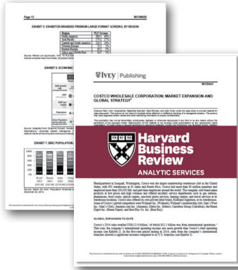
Harvard Business Review

2학기 회원(Junior)은 중간고사 전까지 매주 하나의 Harvard Business Review 케이스를 분석하고, 세션에서 각 문제 상황을 해결할 최적의 옵션은 무엇인지에 대해 토론합니다. 총 3개의 케이스를 풀며 경영 지식을 습득하고, 문제 해결을 위한 전략 도출 과정을 배우게 됩니다. 마지막 Track B Final에서는 OB 선배님의 발제를 통해 실무와 더 밀접한 경영 문제를 접하게 됩니다.