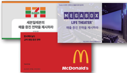
2024~2 Track A 세븐일레븐, 메가박스, 맥도날드